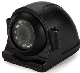
CAMARA MODELO INT-1Z