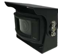
CAMARA MODELO EXT-AX3