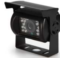
CAMARA MODELO EXT-TZ1